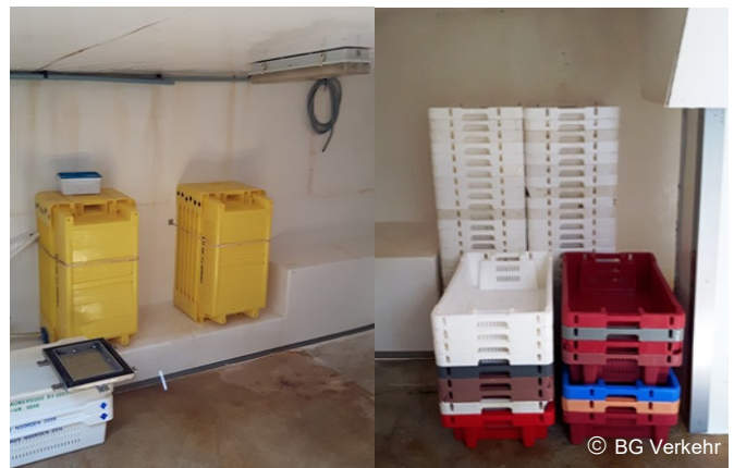
Abb.: Beispiel eines Fischraum mit Isolierung und Betonboden